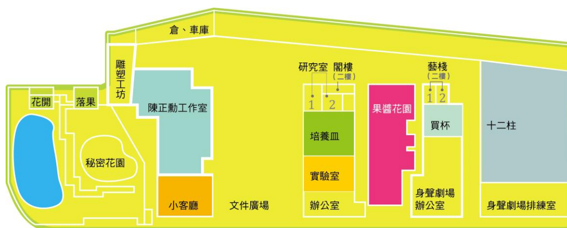
竹園工作室平面圖